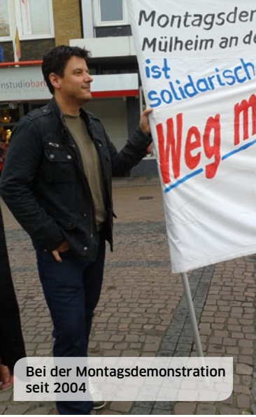
Bei der Montagsdemonstration seit 2004