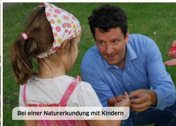
Bei einer Naturerkundung mit Kindern

Die RAG darf seit Jahrzehnten PCB-vergiftetes Grubenwasser ungefiltert in unsere Flüsse einleiten und nimmt heute ungestraft mit der Flutung des eingelagerten Giftmülls unter Tage bewusst