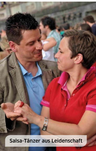
Salsa-Tänzer aus Leidenschaft