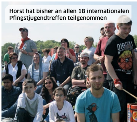
Horst hat bisher an allen 18 internationalen Pfingstjugendtreffen teilgenommen