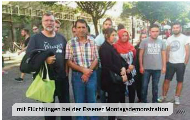
mit Flüchtlingen bei der Essener Montagsdemonstration