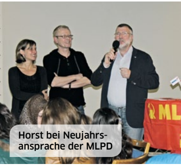
Horst bei Neuja hrs- ansprache der MLPD

Direktkandidat - Wahlkreis 119 im Essener Norden, Osten und Stadtmitte