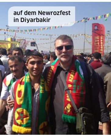
auf dem Newrozfest in Diyarbakir