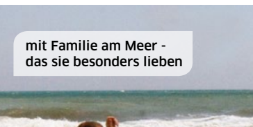
mit Familie am Meer - das sie besonders lieben